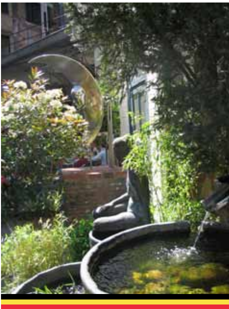
Bryggeriet De Halve Maan er et must.

Ypres er omgivet af markante forsvarsværker.